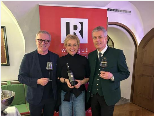
Goldener Hirsch Salzburg